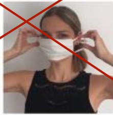
Über die Ohren