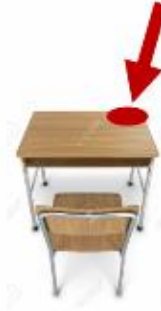
Rechts vorne ablegen